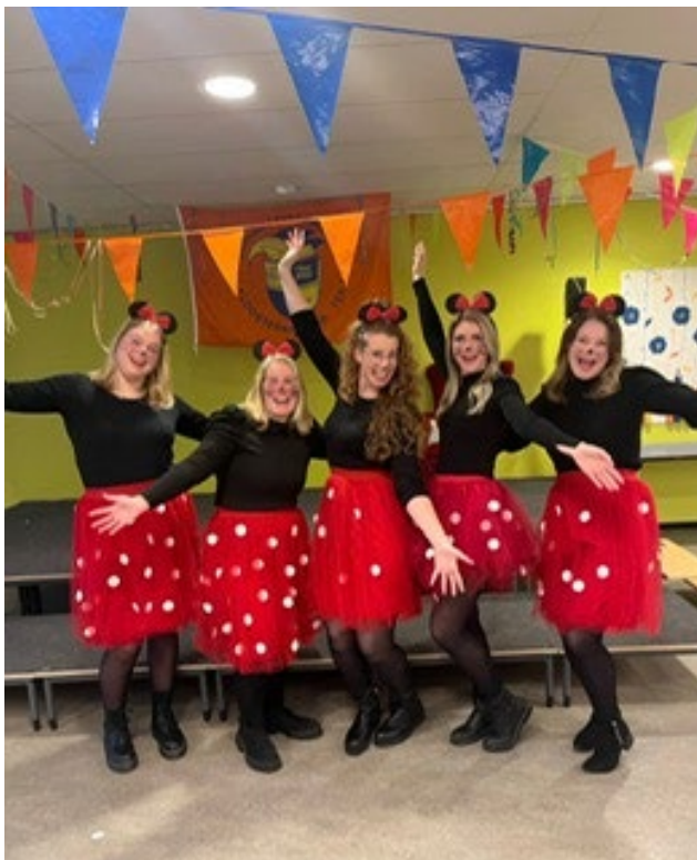
Het team van OBS De Vlinder

Van zaterdag 15 februari tot en met zondag 23 februari is het voorjaarsvakantie! Op maandag 24 februari verwachten wij alle kinderen terug op school.